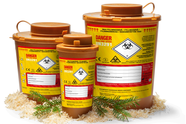
LCA - WoodSafe® vs PP